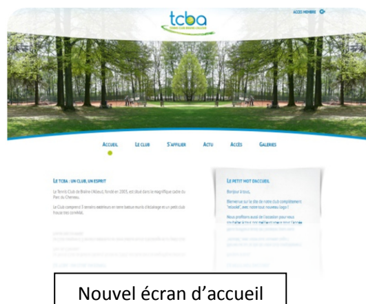
Nouvel écran d'accueil