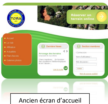
Ancien écran d'accueil

Nouveau logo et nouveau site web! Le TCBA a connu une refonte graphique ces derniers mois afin de redynamiser l'image du club. Ne soyez pas effrayés : toutes les fonctions que vous utilisez sur l'ancien site sont présentes sur le nouveau. Elles sont juste présentées un peu différemment.